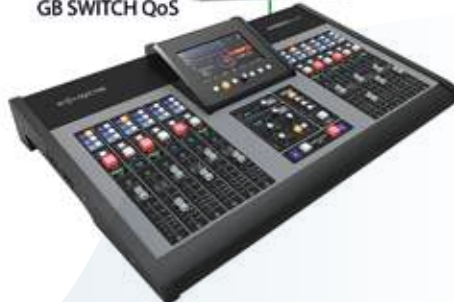
SOLIDYNE UX-24 A67 con módulo UDX A67 (DANCHE AoIP 16x16)