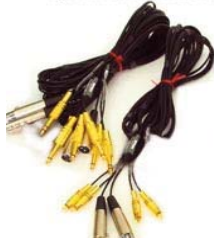
Optional kit cables & connectors